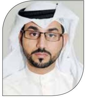
بقلم عيسى الطويل مستشفى عمليات الخفجي المشتركة