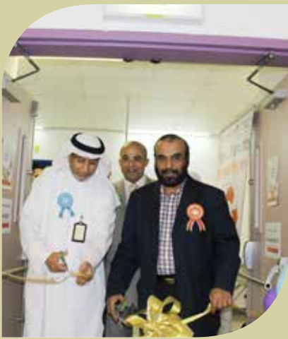
الخدمات الطبية ترعى الفعاليات وتهتم بها

مع كل إشراقة عدد جديد نطلق متسلحين بالأمل والعزيمة والطموح يحدونا هدف سام لننال بهم رضاكم، ونسعى جاهدين دوماً لتحقيقه، وكلنا ثقة بأن نصل إلى تلبية تطلعات قراءنا، وتوجهنا قناعة بأن الدوافع السامية تصنع حياة أروع، وأن الثقة بالله ثم بقدراتنا تصنع إنجازاً متميزاً. نضع هذا العدد الجديد بين أيديكم حاملًا العديد من أنشطتنا في مستشفى عمليات الخفجي المشتركة، وبين طياته رسائل توعوية هادفة ومفيدة. كلنا أمل بأن يكون التوفيق رفيق عملنا، وأن تنال اختياراتنا رضاكم.